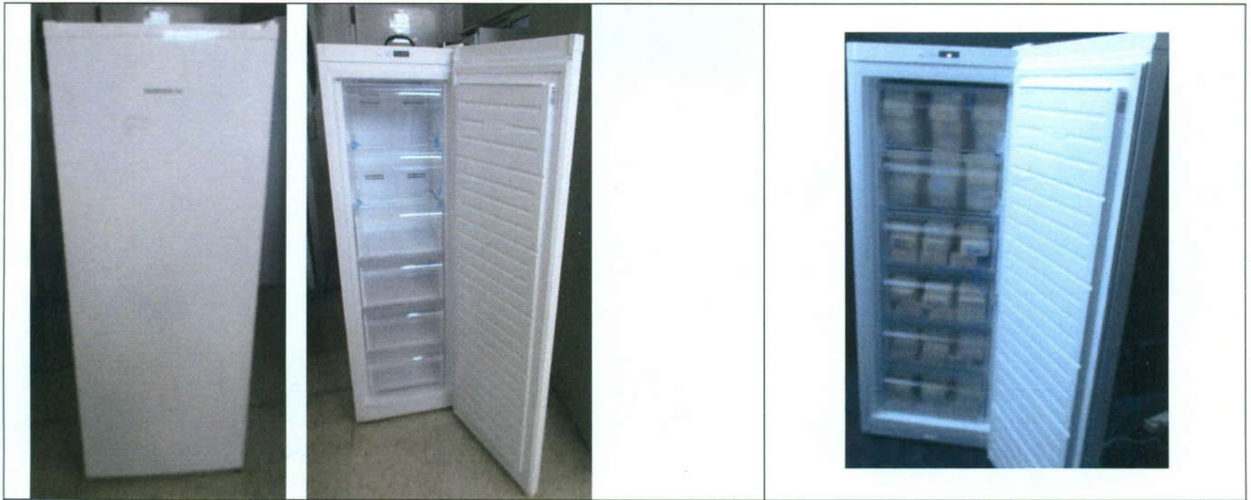
Photos de l'appareil