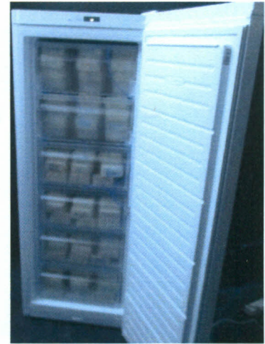
Plan de chargement de l'appareil